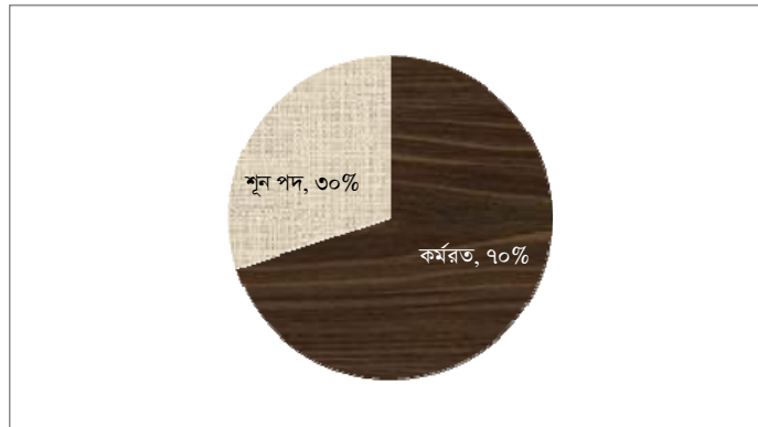
চিত্র ৩.১: সিএজি কার্যালয়, অধিদপ্তর এবং ফিমার জনবলের কর্মরত ও শূণ্য পদের হার